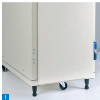
1 Mise en place et déplacement simple et rapide, nettoyage aisé sous l'appareil.

L'armoire est livrée entièrement montée (démontée sur demande).