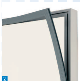
2 Joint magnétique de porte facilement démontable pour une meilleure hygiène.