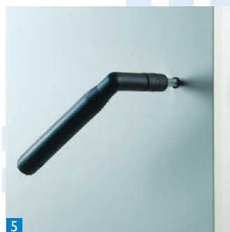
5 Armoire entièrement démontable : panneaux assemblés par crochets excentriques.