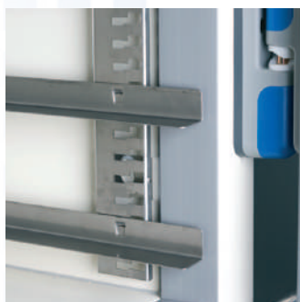
4 Coulisse réglable tous les 21mm, repère de positionnement (demi-lune).